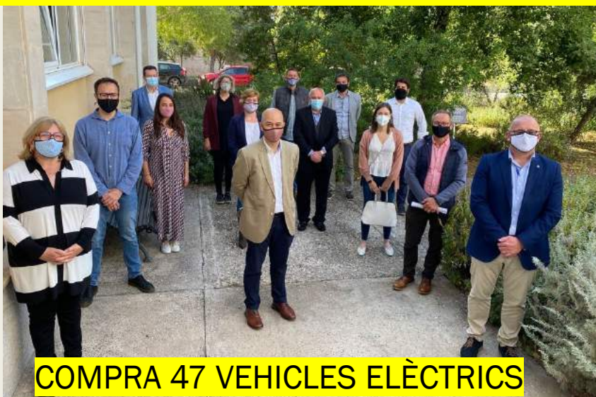
COMPRA 47 VEHICLES ELÈCTRICS