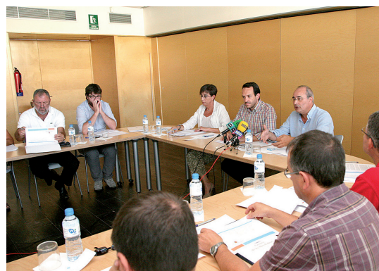
Reunió informativa a Menorca.