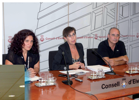
Roda de premsa a Eivissa.