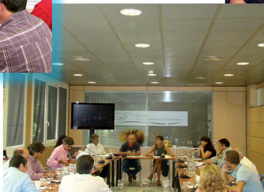
Reunió a la FELIB amb els batles de Mallorca.