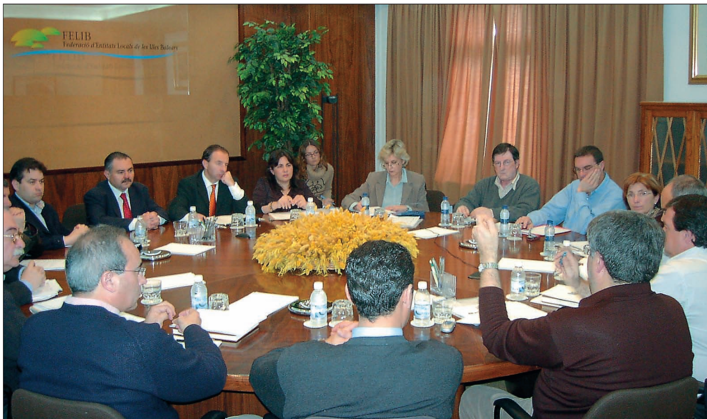
Un moment de la reunió del Consell Executiu de la FELIB.

Els membres aprovaren les reformes fetes als actuals Estatuts de la Federació