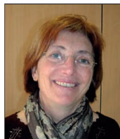
Àngela Caules (Vicepresident 3r. / Consell Menorca)