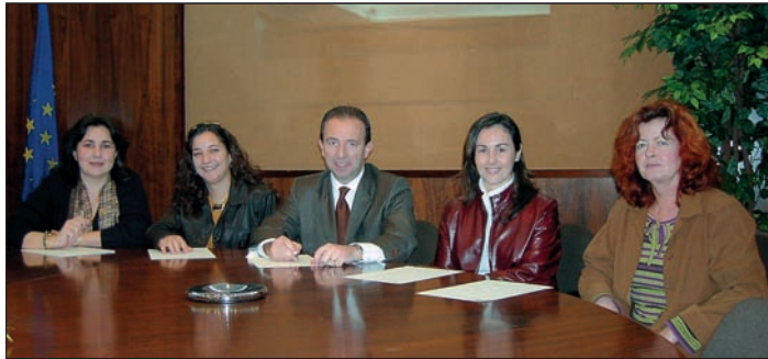
Els membres de la Mesa Paritària, en el moment de la signatura.

D'aquesta forma, amb la signatura d'aquest acord feta pels membres de la Mesa Paritària, se sol·licita a l'INAP