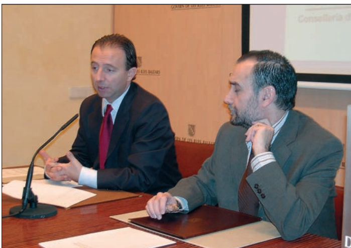
El president de la FELIB, molt satisfet per la signatura.