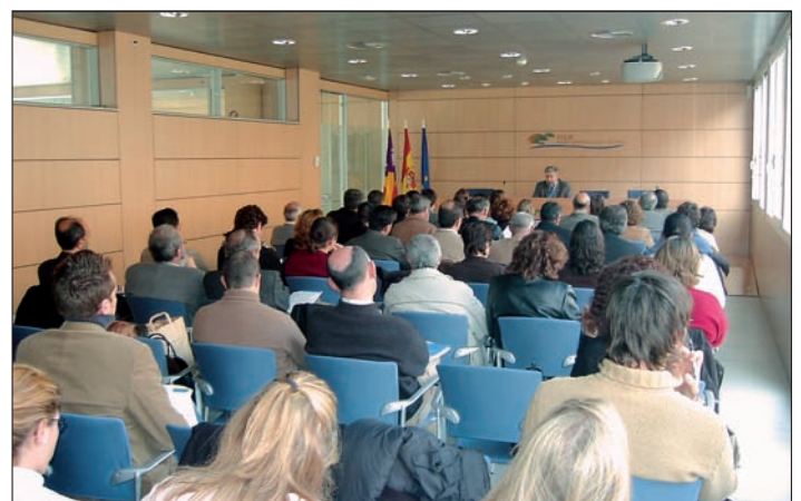
Aspecte de la sala d'actes de la FELIB

Pel que fa a les infraccions molt greus, s'engloben les que dificulten la convivència, i creen problemes a l'hora d'utilitzar l'espai públic i en dificulten el normal funcionament. També s'inclouen els actes d'erosió greu dels equipaments, les