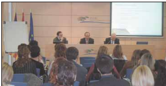
La sala d'actes de la Felib, plena per a la Jornada sobre la Política de Cohesió a la Unió Europea

La sala d'actes de la Felib va presentar un aspecte magnífic