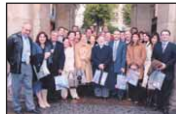
Diferents imatges de l'expedició de la Felib a la capital alabesa.