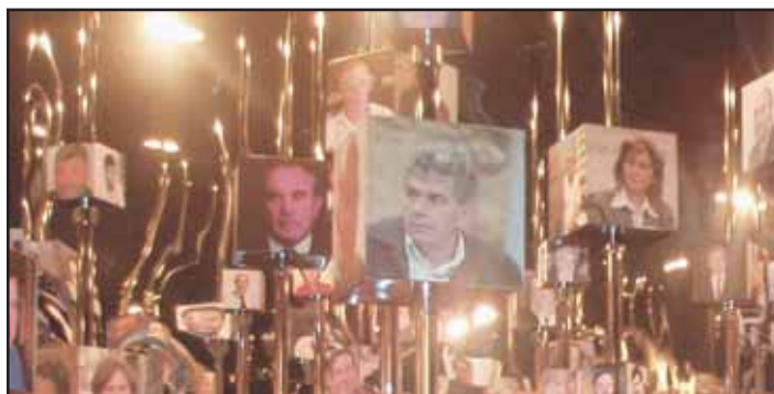
Muntatge visual en el qual es poden observar a diferents personalitats de la vida pública espanyola.