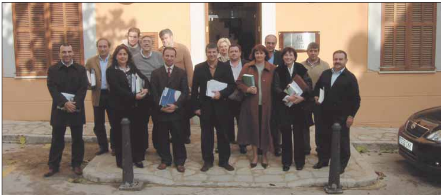
JMembres del Consell Executiu a l'entrada de l'Ajuntament de Santa Eugènia.

E l passat 10 de desembre de 2004 va ser un dia important per a la Felib, ja que en aquesta nova etapa es pretén ser present en els diferents ajuntaments de les Balears a través de les activitats que desenvolupa la Federació.