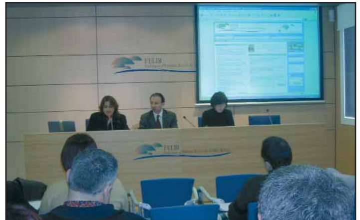
Un moment de l'Assemblea Ordinària de la Felib.

del 2004 i el projecte de pressupost per al 2005, que és molt optimista i reflecteix grans projectes, com l'expansió del