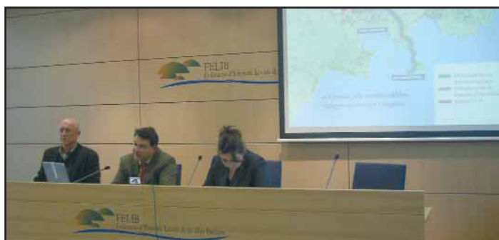
Tots varen seguir les explicacions amb gran interès.