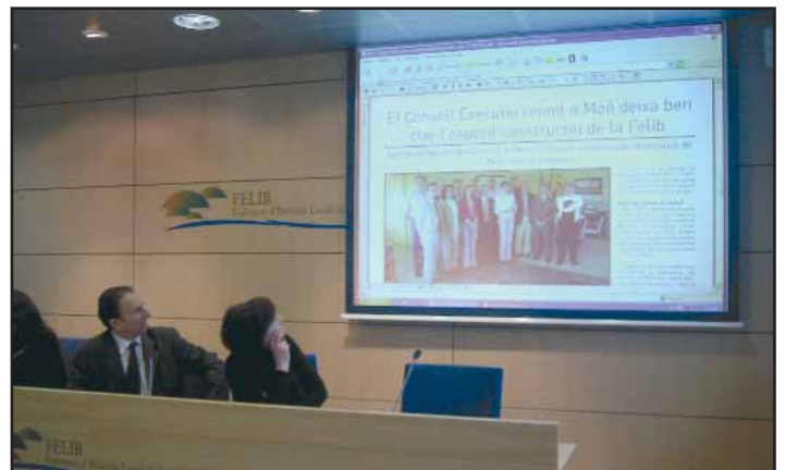
Imatge d'una notícia del butlletí Illes Informació que sortirà a la xarxa.