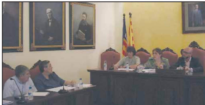
Un moment del Consell Executiu de Manacor.