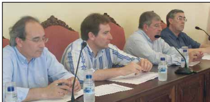
Els assistents varen seguir amb atenció la Executiva.

L'objectiu d'aquest acord és establir una col·laboració mútua entre el CIM i la Felib sobre les activitats de formació ocupacional i d'orientació laboral de les escoles taller i les cases d'ofici dins l'àmbit mediambiental.