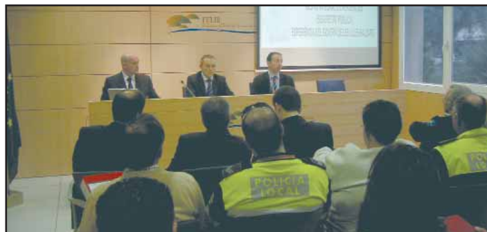
Un moment de la presentació de la Jornada.