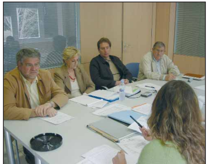
Un moment de la reunió feta a la seu de la Felib.

I, per finalitzar l'ordre del dia, el Departament d'Assessoria Jurídica de la FELIB va donar compte dels diferents informes i estudis del primer trimestre del 2005.