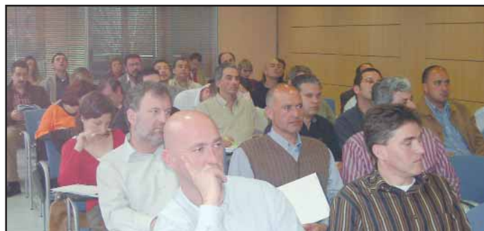
Els assistents segueixen la Jornada amb expectació.

trada del Decret 2/2004, de mesures mínimes de seguretat a les platges, Calvià ha modificat les funcions que duen a terme a les seves platges durant la darrera dècada per adaptar-les al Decret, millorar-ne alguns aspectes humans i