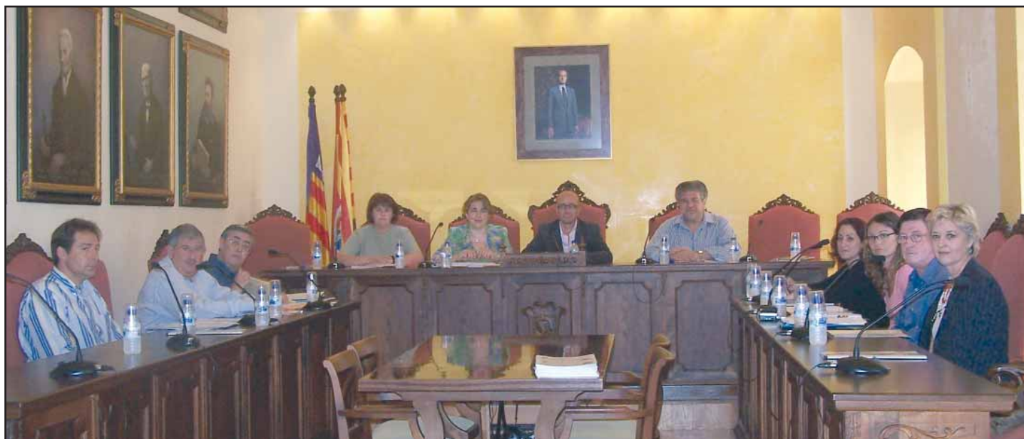
Panoràmica de la Sala de Plens del Ajuntament de Manacor abans de donar inici al Consell Executiu.

Es va informar sobre un possible conveni entre la Felib i el TSJB