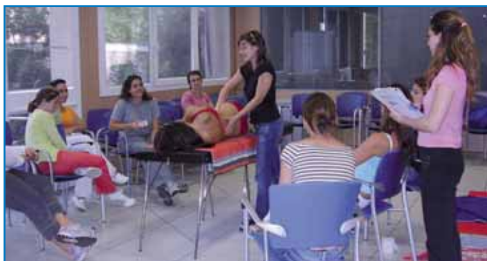
Imatge del curs de massatges fet a la FELIB.