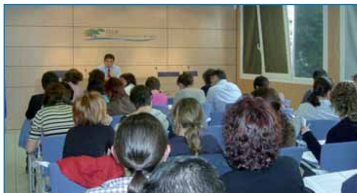
Els cursos completen amb una gran acceptació.