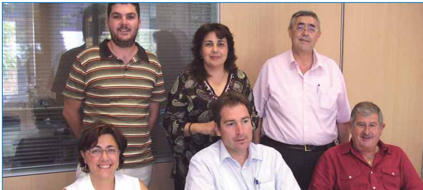
Membres de la Comissió del Projecte sobre la Llei del Sòl abans de començar la reunió.

La Comissió del Projecte sobre la Llei del Sòl que es reuní a la seu de la FELIB, va decidir per unanimitat remetre un escrit al Parlament perquè el Projecte de llei del sòl es retorni al Govern i es torni a fer de nou, pel fet de considerar que la majoria dels articles d'aquest avantprojecte no estan gaire clars ni definits.