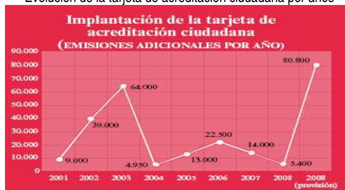
Evolución de la tarjeta de acreditación ciudadana por años

El plan de extensión de la TAC contempla un programa de incorporación sucesiva de entidades locales al proyecto. Para ello se constituye un sistema de fomento mediante ayudas a través de una convocatoria anual. Gracias a este sistema contamos en la actualidad con la distribución de más 200.000 tarjetas ciudadanas en 51 entidades locales dispersas por toda la geografía de Navarra con una población de 600.000 habitantes.