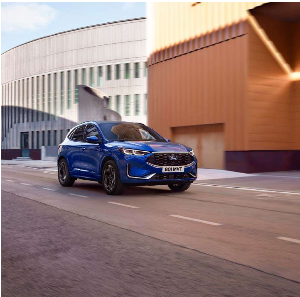
Guía de resumen del Ford Kuga MY2024.5