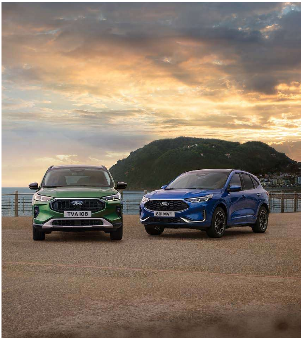
Guía de resumen del Ford Kuga MY2024.5

Los siguientes equipamientos también son nuevos en el Kuga: