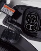
Conector de carga tipo 2 (Mennekes) y conector CCS