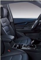
Interior negro y azul