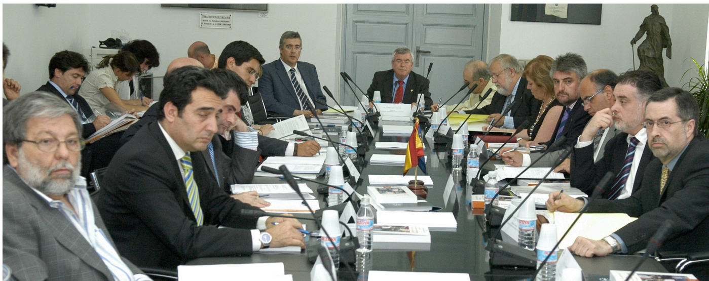
El Consell Territorial de la FEMP va reiterar la necessitat de negociar la reforma del finançament local amb l'autonòmic.

El passat 19 de juny va tenir lloc la reunió del Consell Territorial de la FEMP, en què totes les federacions de municipis de l'Estat espanyol que hi estan integrades, inclosa la FELIB, varen donar el seu suport unànimement als criteris i a la metodologia en què es basa la Federació Espanyola de Municipis i Províncies per negociar amb el Govern el nou model de finançament local. Així mateix, els representants convocats varen expressar la seva voluntat que el procés de negociació es dugui a terme simultàniament i de manera vinculant a la negociació del finançament autonòmic. Aquesta convocatòria del Consell Territorial de la FEMP va coincidir amb l'encontre entre el Ministeri d'Economia i Hisenda per encetar aquest procés de reforma.