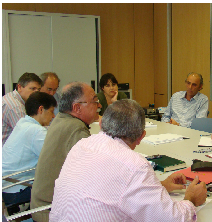
Els membres de la comissió s'assebentaren de com es resoldran finalment les seves propostes.